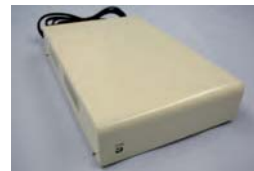
コードレスアダプタ88369a

【コードレスアダプタ】 コードレス電話機、またはアナログ電話機を使用して通話連絡ができます。