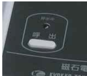
従来のハンドルを回す操作から、ボタンを押す操作になり呼出時の操作性が向上しました。