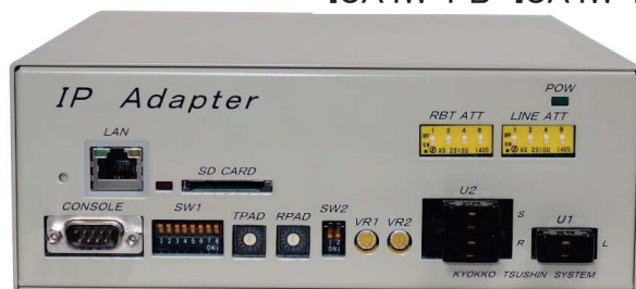
ICA2W-TS ICA2W-PB ICA2W-MG