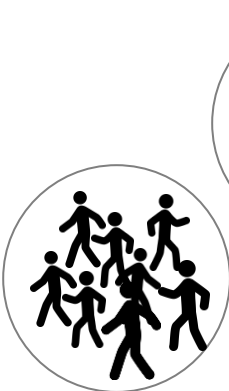
利用者が多いホーム内